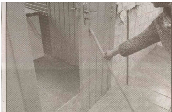
Um cabo de vassoura é colocado na porta, que não possui trinco

Expresso Popular Terça-feira, 6 de Outubro de 2009