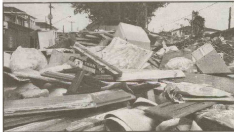
AV. SÃO JORGE

Um trecho do canteiro central é ocupado por lixo, monte de terra, pedaços de madeira e entulho.