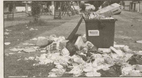
PRAÇA EDUARDO DOS SANTOS CLAUDIO

Depois que um pedaço da rua cedeu e começou a vazar esgoto, moradores colocaram entulho no meio da via pública na tentativa de evitar acidentes.