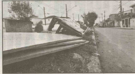
AV. SÃO JOÃO

Um trecho do canteiro central é ocupado por lixo, monte de terra, pedaços de madeira e entulho.